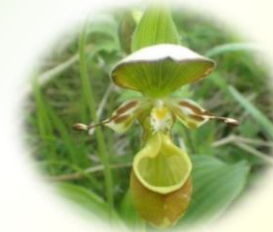
キバナアツモリソウ