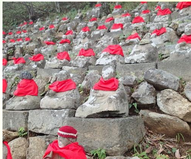
登山道にある八十八大使