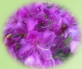
トウゴクミツバツツジ