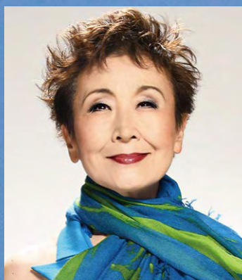
歌手 加藤登紀子 さん