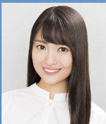
女優 北原里英 さん