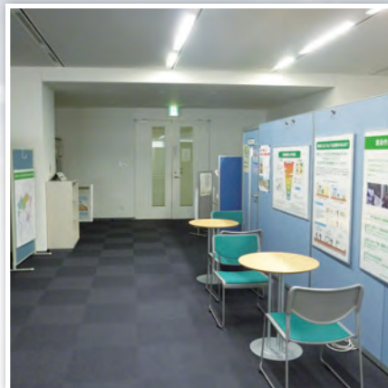
▲ 除染情報コーナー

東日本大震災に伴う東京電力福島第一原子力発電所の事故により、広範囲に渡って放射性物質による汚染が生じています。