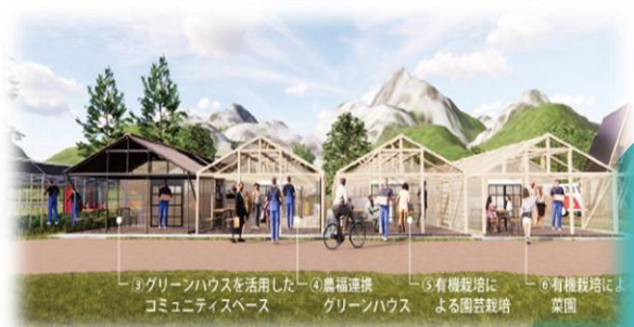
環境配慮型栽培ハウスのイメージ