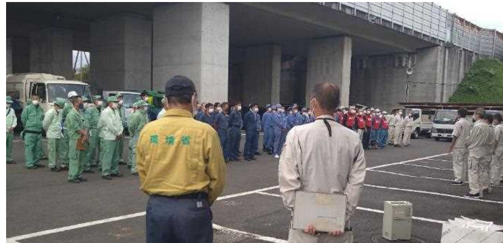
静岡市からの熊本・川崎・名古屋・横浜・伊豆市の 撤退式 (令和4年10月16日)