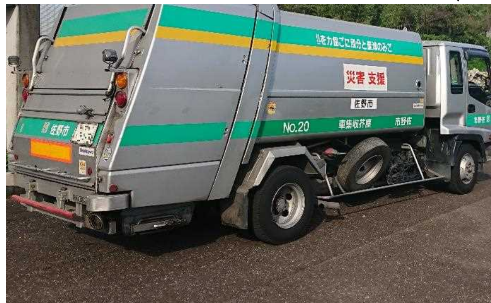
佐野市の活動状況 トラック協会仮置場 (令和4年10月4日)