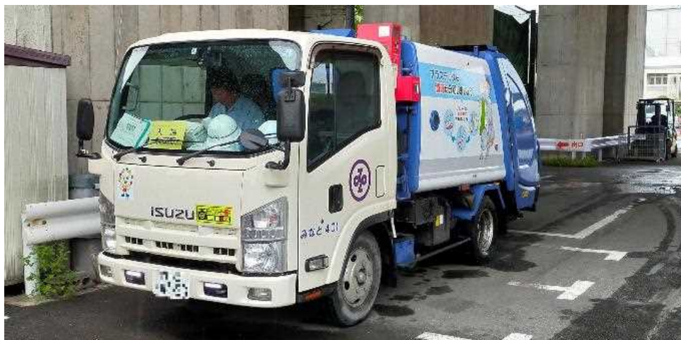
東京都港区の活動状況 清水収集センター (令和4年10月7日)