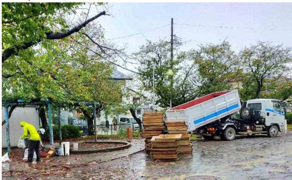
産廃協の活動状況 清水区押切公園 (令和4年10月7日時点)