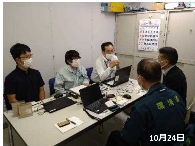
静岡県川根本町の支援を行う栃木県栃木市職員（令和4年台風第15号）