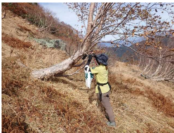
センサーカメラによる調査（北岳草すべり）