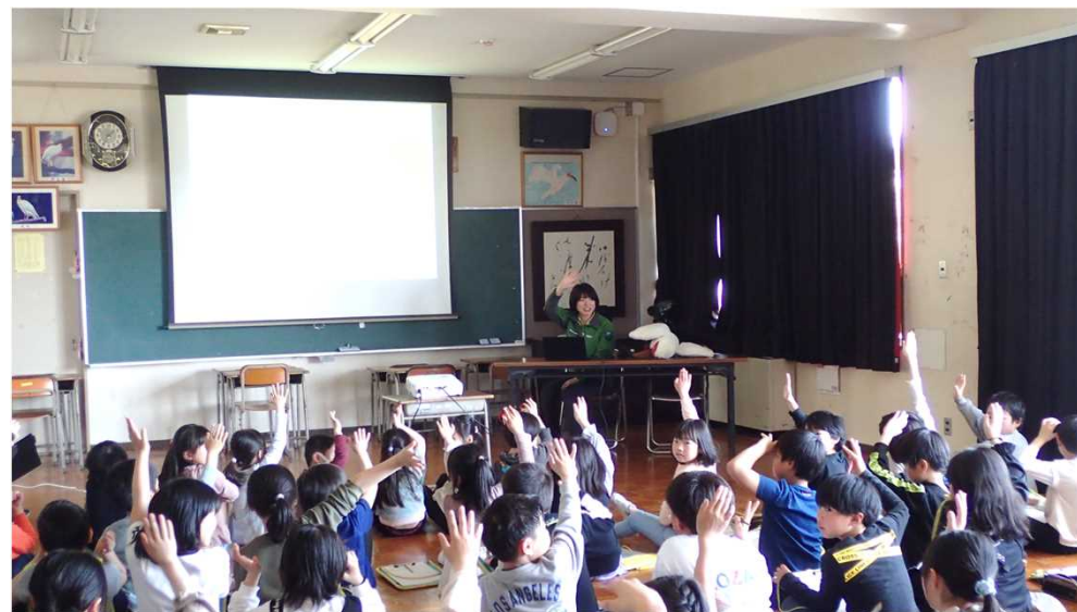
▲地元の小学校での環境授業の様子