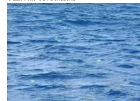
洋上に流出した殺鼠剤

洋上及び海岸における殺鼠剤回収量（1袋10g） 洋上 中身なし 389袋 中身あり 12872袋 海岸（父島島内4か所） 40袋