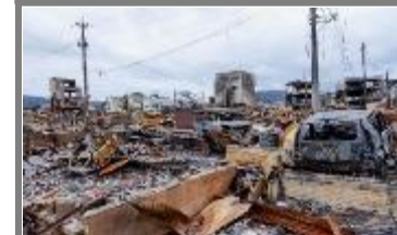
令和6年能登半島地震 輪島市内の火災被害