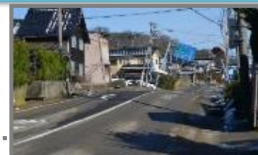
令和6年能登半島地震 内灘町内の液状化現象