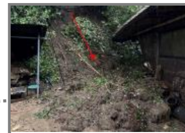
令和6年台風10号 宮崎県で発生したがけ崩れ