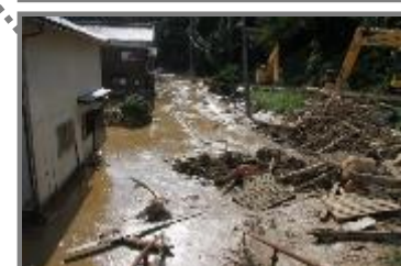
令和6年9月20日からの大雨 珠洲市の河川土砂堆積現場

「大規模災害発生時における地方公共団体の業務継続の手引き」（令和5年5月改定）【内閣府（防災担当）】