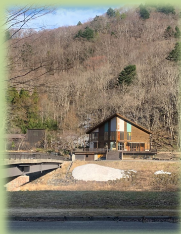
ここのはパーク ミニ尾瀬アートエリア

雨天決行。前日16時時点で荒天や警報等が見込ま れる場合には中止といたします。 お申し込みの詳細は裏面をご確認ください。