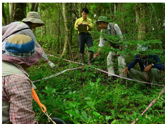
活動風景（左：自然観察会、右：植生調査）