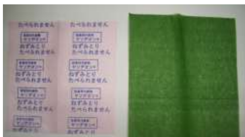
写真 2 スローパック用の紙 左：市販品、右：今回使用予定 （使用時には左と同様に印字）

「平成 19 年度小笠原地域自然再生事業クマネズミ対策業務検討会資料」（環境省）より