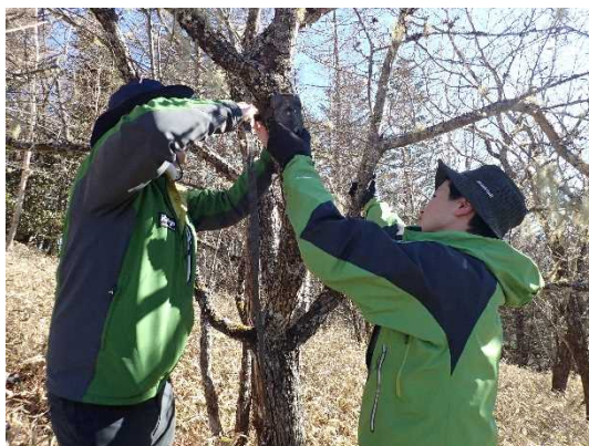
センサーカメラによる調査（夜叉神峠）

参考：関東地区アクティブ・レンジャー日記 http://kanto.env.go.jp/blog/