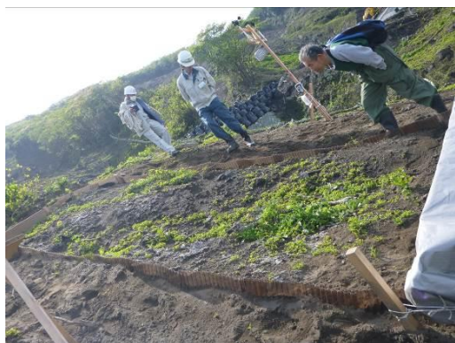
伊豆大島ジオパークと連携した植生調査

参考：関東地区アクティブ・レンジャー日記 http://kanto.env.go.jp/blog/