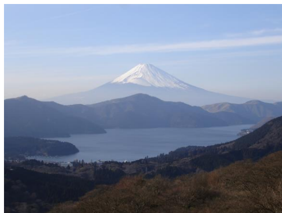
富士箱根伊豆国立公園（大観山からの富士山）